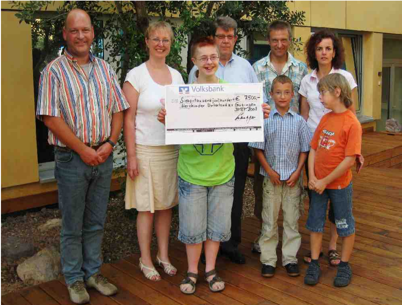
Spendenübergabe bei der Firma Layher

Summe von 7.500 Euro zusammen. Nachdem in den Vorjahren die Diakonische Jugendhilfe Region Heilbronn und die Lauffener Kaywaldschule unterstützt wurden, fiel die Wahl dieses Jahr auf den Verein Herzkinder Unterland e.V., der herzkranken Kinder und deren Familien zur Seite steht.