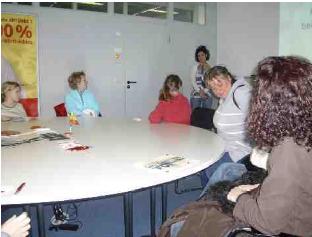
Überblick und Einweisung im Besprechungsraum

Nach 2 Jahren war es wieder so weit, wir durften in die Radiosendezentrale von HitRadioAntenne1 in Stuttgart. Im Pressehaus in der Lobby versammelten wir uns. Und kurz nach halb 3 wurden wir von einer netten Dame abgeholt. Und erst in einen kleinen Besprechungsraum gebracht. Dort führte sie uns eine Powerpoint Präsentation vor. Über 100 Mitarbeiter hat HitRadio-Antenne1 auf 5 Zentralen verteilt.