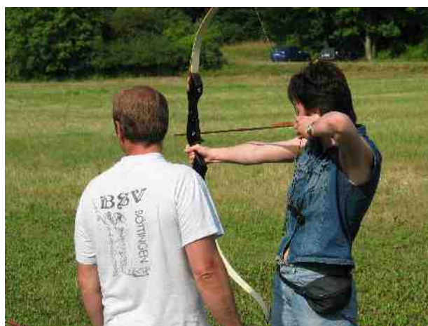
Anfängerin beim Üben