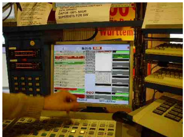
So sieht der Arbeitsplatz eines Radiosprechers aus

Noch kurz ins Aufnahmestudio und schon ging's weiter in das Studio, live auf Sendung. Bei „Stefan“, in Vertretung von „Max am Mittag“. Er zeigte uns die aktuelle Wiedergabeliste. So weiß er wann er was sagen muss, dann musste absolute Stille sein, die Nachrichten wurden verlesen. Die Sprecherin saß in einem extra Raum und las, die aktuellen Nachrichten vor. Dabei machte sie Mundgymnastik, das hat lustig ausgesehen. Nach den Nachrichten verlas der Staupilot die Staus und Blitzer.